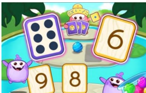
Сурет 1 - «Нүктелерді сана»

1-суреттегі «Нүктелерді сана» деп аталатын санауға арналған оқу ойыны. Ойынның мақсаты – бір карточкадағы нүктелердің санын басқа карточкадағы сәйкес цифрмен сәйкестендіру. Суретте алты нүктесі бар карточка және цифр 6 жазылған карточка көрсетілген, бұл – дұрыс сәйкестік.