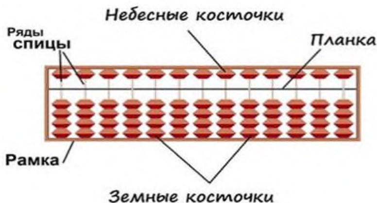
Рисунок 1 – Внешний вид счет Абакус

В каждом ряду абакуса находится пять косточек: верхняя (небесная) косточка – это цифра пять и под перегородкой – четыре (земные) косточки, каждая из которых равна единице [5, с.7].