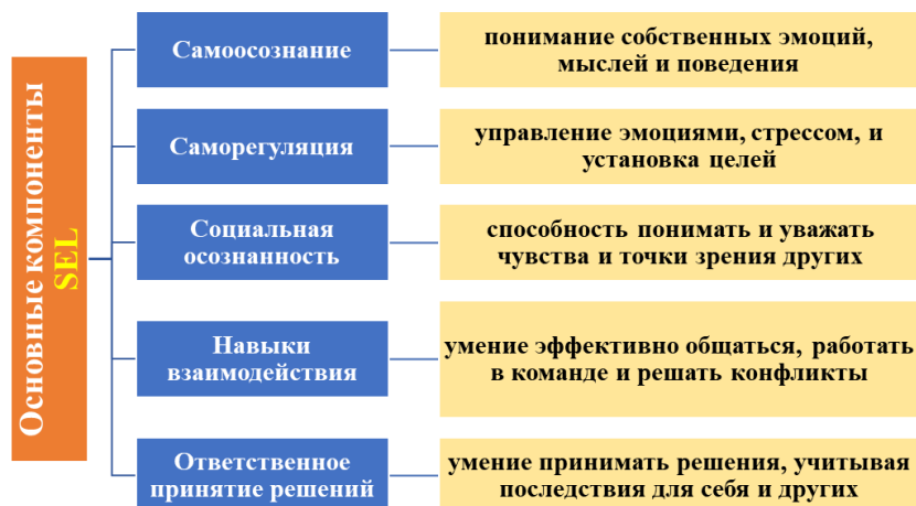
Рисунок 1. Основные компоненты социально–эмоционального обучения SEL