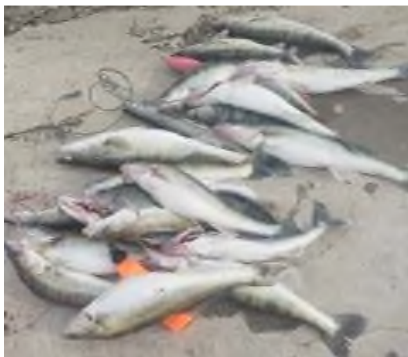
Рисунок 4 – Часть одноразового вылова рыб в реке Тобол. 10.06.2024. Костанайская область

Сравнивая уловы в двух реках, можно выделить несколько различий. Общая масса одноразового вылова в реке Убаган (51,1 кг) была выше, чем в реке Тобол (47,6 кг), что может свидетельствовать о более высокой биологической продуктивности рыб в реке Убаган. По видовому составу в реке Убаган преобладали карась и щука, тогда как в Тоболе – судак и щука. В реке Тобол pH воды был выше, чем в реке Убаган, вода более мутная и содержала больше металлов, что может указывать на влияние промышленных и сельскохозяйственных факторов и влияния сточных вод, попадающих в реку.