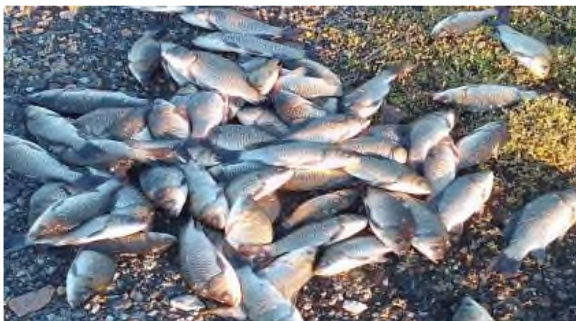
Рисунок 2 – Часть одноразового вылова в реке Убаган. 10.06.2024. Костанайская область.