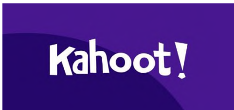
Рисунок 1—платформа «Kahoot!»

Также стоит обратить внимание на использование платформы «Kahoot!». Это инструмент для создания интерактивных опросов и викторин, который позволяет учителям вовлекать всех учеников вне зависимости от уровня их подготовки[4].