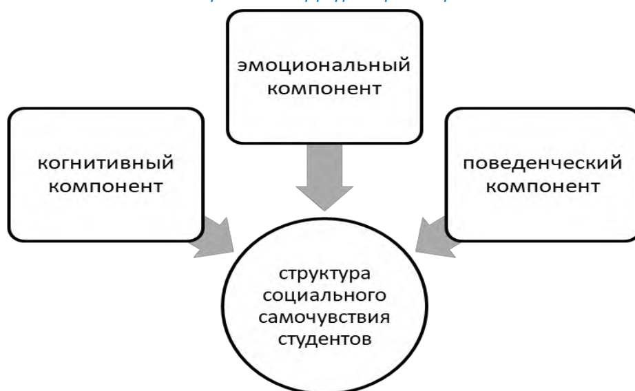
Рисунок 1 – Структура социального самочувствия студентов

Содержание когнитивного компонента составляют знания, понимание и оценку социальных процессов и своего места в системе социальных отношений общества.