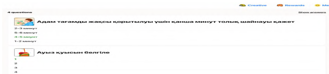
Сурет 1. Асқорыту жүйесі тақырыбында берілген тапсырмалар

Практика жүзінде 3 сынып. Адам тарауының «Ас не үшін қажет?», «Ас қорыту жүйесі» тақырыптары қарастырылды. Бұл тақырыптарға осы платформаны қолдана отырып мынадай тапсырмаларды жүзеге асырдық. Сабақ барысында тапсырмаларды орындау кезінде оқушылардың белсенділігімен қызығушылықтарының қалай артқаның байқадық. Себебі кейбір зейіні төмен оқушылардың өздері назар салып, қызығушылық танытты. Ойын барысында жаңа қабілеттері ашылып, мінез-құлықтарының ерекшеліктері байқалды. Оқушылар ойын ойнай отырып, тақырыпты жеңіл меңгерді. Тақырыпты қорытындылау мақсатында мынадай қорытынды тест жүргізілді. (Сурет 1)