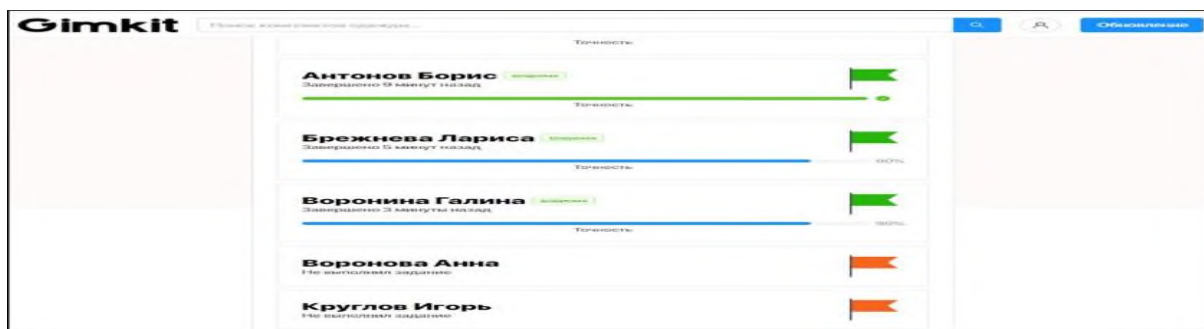
Сурет 3. Оқушылардың тапсырманы орындаудағы ретінгі.

Сыныпта тапсырмаларды ұйымдастырумен қатар үй тапсырмасын ұйымдастыру мүмкіндігі де бар.(сурет 3)