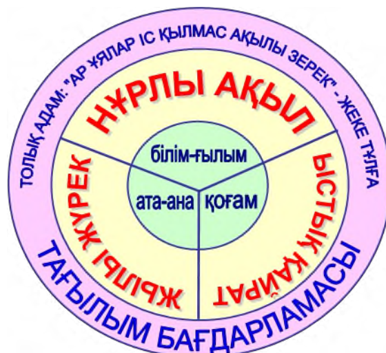
Сурет 1, Абайдың «Толық адам» концепциясы.

«Біртұтас тәрбие» бағдарламасында «Тәрбие – ұрпақты биік мұратқа жетелейтін сапалы білімнің тұғыры және тұлғаның адамгершілік тұрғыдан толысуын қамтитын үздіксіз процесс» делінген. Сәйкесінше, «Жеке тұлғаны қалыптастыру» тағылым бағдарламасында сол процестің жүзеге асырылуы сынып жетекшісінің не куратордың тәрбие сағатын пәндік жүйеде 45 минуттық сабақтың көлемімен саналы сезімге негізделіп жүргізілетін сабақ түрінде қарастырылған. Сондықтан ұсынылған тағылым бағдарламасын «Біртұтас тәрбие» бағдарламасының оқу–әдістемелік құралы деуге боларлық толық негіз бар.