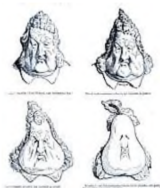
Рисунок 1. «Груши». Карикатура на короля Луи–Филиппа. 1831 г. О.Домье