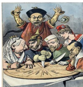
Рисунок 5. «Пирог королей и императоров»

Представим несколько примеров работы с карикатурой на уроках всемирной истории в 7 классе. В начале урока по теме: Почему в Китае до сих пор помнят опиумные войны? учитель предлагает учащимся проанализировать карикатуру «Пирог королей и императоров» А. Мейера, 1898 года выпуска и ответить на вопросы: