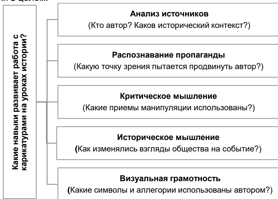
Схема 1. Навыки, развивающиеся при работе с карикатурой на уроках истории

Карикатура в свою очередь способствует развитию медиаграмотности и критического мышления в целом.