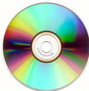
Сурет 2 – Зерттеу жұмысына арналған компакт диск

диаметрге қатынасы тұрақты шама – \pi саны екенін тәжірибелік түрде анықтайды. Формуланы осылай түсіну оны жаттаудан гөрі әлдеқайда терең және тұрақты болады, себебі ол жеке тәжірибеге сүйенеді. Сонымен қатар, бұл әдіс оқушылардың өздігінен зерттеу дағдыларын дамытады, оларға математиканың нақты өмірмен байланысын көруге мүмкіндік береді және пәнге деген қызығушылығын арттырады. Осылайша, формуланы тәжірибе арқылы үйрену оны тек қолдануды емес, сонымен қатар оның мәнін түсінуді қамтамасыз етеді, бұл білімнің сапасын айтарлықтай жақсартады.