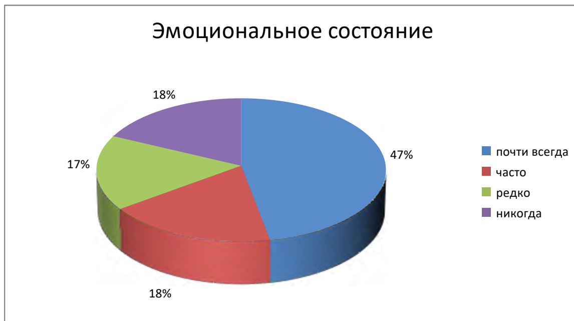
Рисунок 1. Эмоциональное состояние