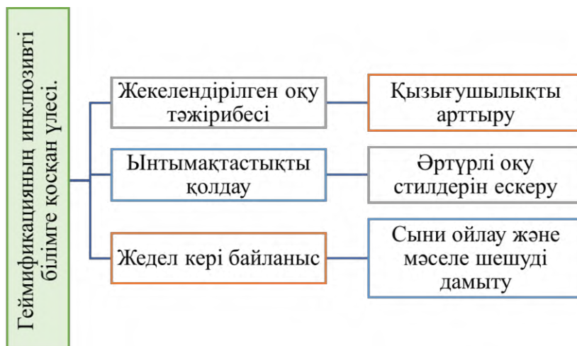
Сурет 2. Геймификацияның инклюзивті білімге қосқан үлесі

Геймификация әдістерін білім беру процесіне енгізу оқушылардың мотивациясын арттырып, оқу белсенділігін күшейтудің тиімді құралына айналды [6].