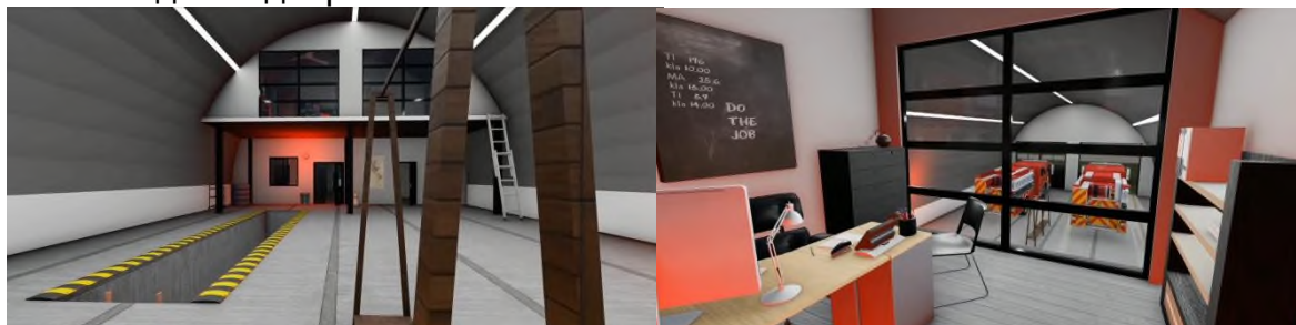
Рисунок 2. Интерьеры

Кроме этого студенами был предложен и разработан интерьер здания, выполненный в стиле минимализм (рис.2). Для более наглядного представления о проекте был создан видеоролик.