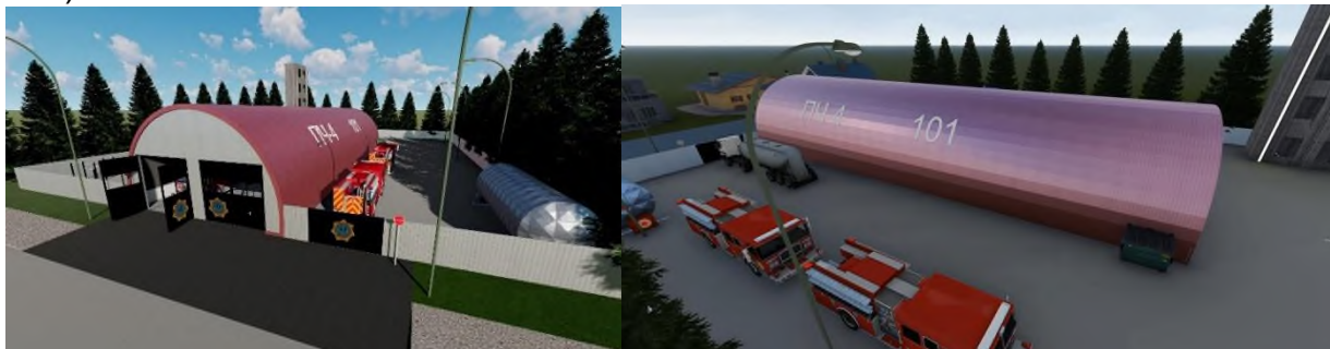
Рисунок 1. Фрагменты 3–д визуализации проектируемого здания

Поскольку заказ был на проект эскизный, то в процессе проектирования были разработаны чертежи планов этажей, фасады. Выполнена 3д–визуализация проекта (рис.1).