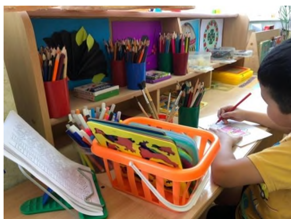
Рисунок 5 Центр изобразительной деятельности