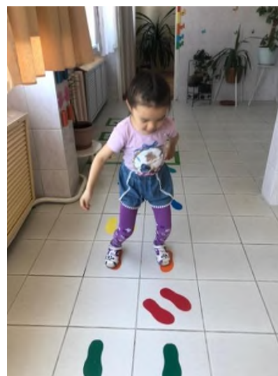
Рисунок 10 Следы на полу