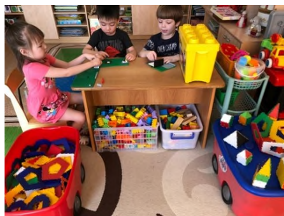
Рисунок 4 Центр конструирования