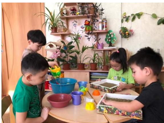
Рисунок 3 Центр природы и игр с песком и водой