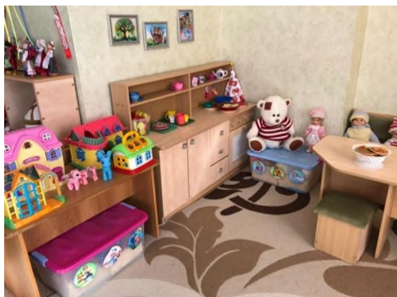
Рисунок 1 Центр сюжетно – ролевой игры