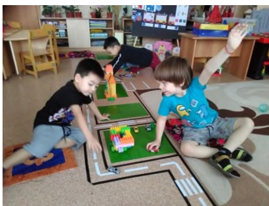
Рисунок 8 «Правила движения» –схему дорог

Далее возникла идея создания «Классиков на полу», которые помогают решать нам несколько задач: знать цифры от 1 до 10, закреплять порядковый и обратный счет, закреплять умение соотносить количество предметов с цифрой и знании цветов цветового спектра. Игра «Следы» также многофункциональна: помимо того, что ребенок двигается (здоровьесберегающая технология) он активизирует словарь по заданной теме. Например: «Прыгай и называй диких животных». Таким образом можно закреплять звуки – гласные и согласные, уточнять знания об окружающем мире.