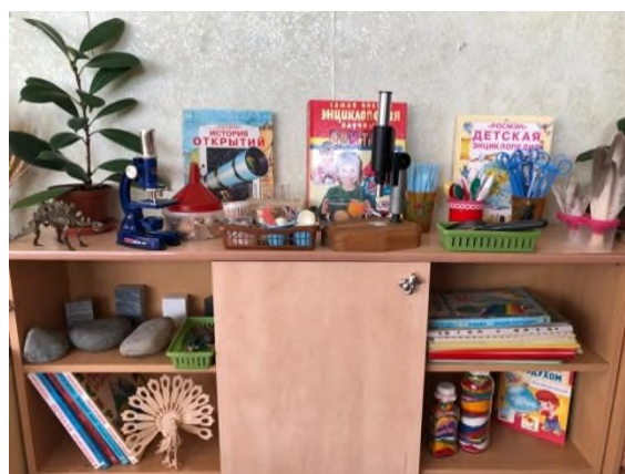
Рисунок 2 Центр экспериментирования