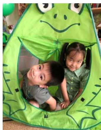
Рисунок 6 Уголок уединения

Кроме того, в нашей группе создан мини – музей «Музей одежды». В котором дети не только могут познакомиться с историей создания одежды народов мира, национальными костюмами народов, проживающих на территории Казахстана, но и во время игры закрепить знания одежды разных профессий, виды современной, сезонной одежды.