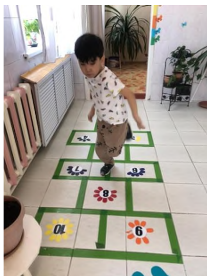
Рисунок 9 Классики на полу

Далее возникла идея создания «Классиков на полу», которые помогают решать нам несколько задач: знать цифры от 1 до 10, закреплять порядковый и обратный счет, закреплять умение соотносить количество предметов с цифрой и знании цветов цветового спектра. Игра «Следы» также многофункциональна: помимо того, что ребенок двигается (здоровьесберегающая технология) он активизирует словарь по заданной теме. Например: «Прыгай и называй диких животных». Таким образом можно закреплять звуки – гласные и согласные, уточнять знания об окружающем мире.