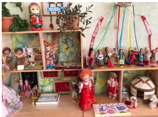
Рисунок 7 Мини – музей «Музей одежды» на полу

на полу схему дорог, улиц, перекрестов. Для этих игр изготовили для детей дорожные знаки.