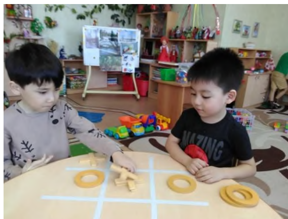
Рисунок 12 Дети играют в «Крестики и нолики»

Дальше мы изучили возможности использования кинезиологических игр и игровых упражнений для развития межполушарных связей и активизации умственной деятельности и включили их в развивающую среду нашей группы.