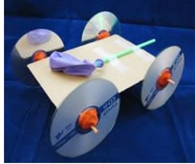
4 Сурет Өртүрлі материалдардан жасалған ауа шарымен қозғалатын келіктердің бірнеше мысалы

Қорытынды: Жүргізілген зерттеу нәтижелері мұғалімдердің басым көпшілігі жоба әдісін оқу үдерісінде тиімді деп есептейтінін көрсетті. 80%-дан астам педагог бұл әдісті өз тәжірибесінде қолданатынын және оның оқушылардың шығармашылық қабілеті мен зерттеушілік дағдыларын дамытуға ықпал ететінін атап өтті. Сонымен қатар, мұғалімдердің 75%-ы сабақ барысында жасанды интеллект (ЖИ) платформаларын пайдаланатынын, бұл оқу процесін жеңілдетіп, оқушылардың қызығушылығын арттыратынын көрсетті. Сауалнама нәтижелерінен көрініп тұрғандай, негізгі қиындықтардың бірі — уақыт тапшылығы (60%) мен әдістемелік дайындықтың жеткіліксіздігі (55%). Бұл жоба әдісін тиімді қолдану үшін қосымша оқыту курстары мен әдістемелік нұсқаулықтардың қажеттілігін дәлелдейді. Жоба әдісін заманауи цифрлық және жасанды интеллект технологияларымен ұштастыру — қазіргі білім беру жүйесінің инновациялық бағыты болып табылады. Ол оқушылардың жеке әлеуетін ашуға, сын тұрғысынан ойлау мен проблеманы шешу қабілеттерін дамытуға мүмкіндік береді [5].