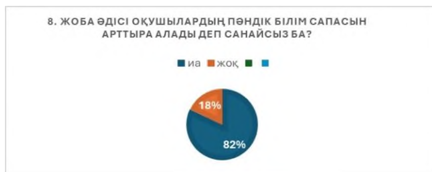
2 Сурет Сауалнаманың сегізінші сұрағының нәтижесі

Мұғалімдердің көпшілігі 82% оқушылар жобалық тапсырмаларды қызығушылықпен орындайтынын айтты. Бұл әдіс оқушы мотивациясын және белсенділігін арттыруға тиімді екенін дәлелдейді.