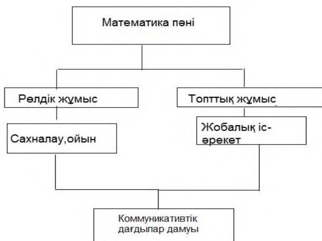
Сурет 2-Оқыту үдерісіндегі интеграциялық модель

Рөлдік және топтық жұмыстың интеграциялық үлгісі