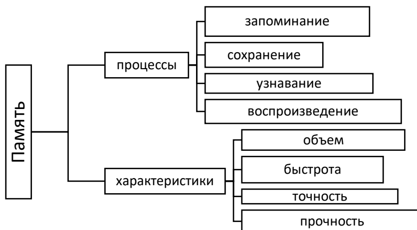
Рисунок 1. Особенности памяти.

именно объем запоминания, быстрота запечатления новой информации, точность воспроизведения, длительность сохранения, готовность к использованию данной сохраненной информации. Изучим подробнее данные свойства.