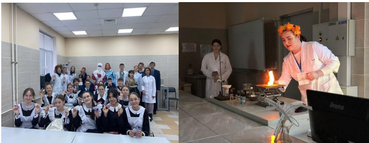
Рисунок 2. Элемент XXX Фестиваля химии – 2024

Каждое мероприятие студентов включало в себя тематический сценарий с проведением занимательного химического эксперимента с обязательным соблюдением правил техники безопасности (см. Рис. 2). В каждой мини–группе студенты включали в проведении химического опыта самих учеников, предоставляя им халаты и перчатки (при необходимости).