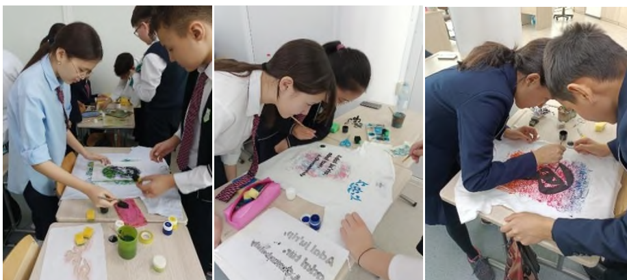
Рисунок 2. Примеры работы учащихся с различными техниками и материалами