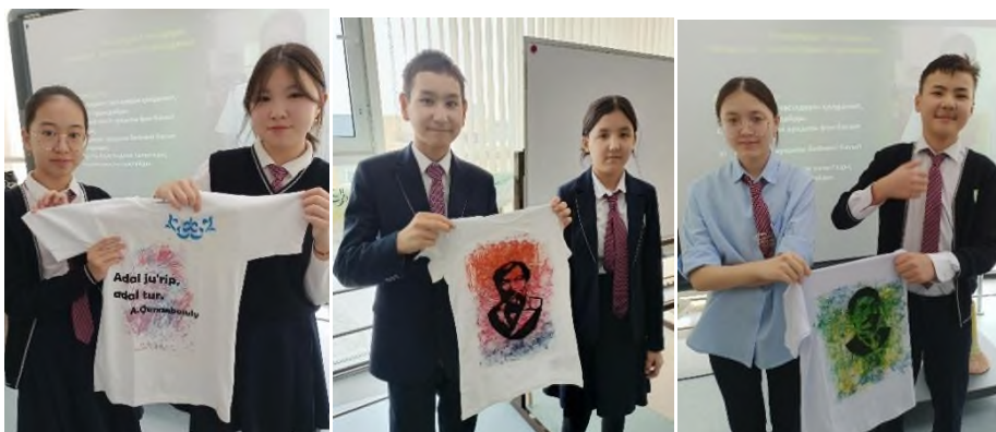
Рисунок 3. Презентация выполненных работ

Также стоит отметить, что применение метода ТРИЗ способствовало улучшению взаимодействия между учащимися. Групповые проекты, основанные на принципах ТРИЗ, помогли развить навыки командной работы и сотрудничества. Учащиеся научились делиться идеями, обсуждать их и совместно находить решения, что положительно сказалось на их социальной адаптации и коммуникационных навыках.