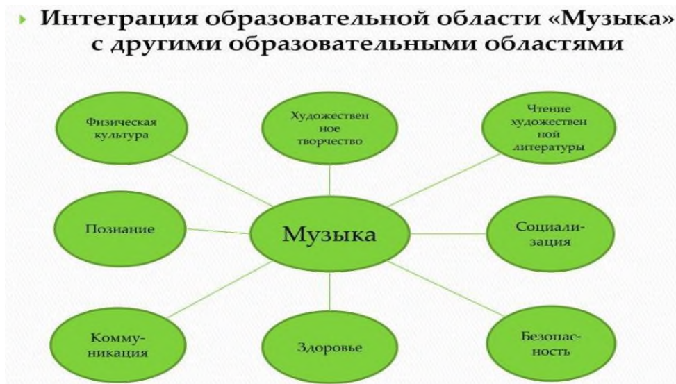
Рисунок 1. Интеграция музыкальной области с другими образовательными областями

Интеграция в музыкальном образовании представляет собой многослойный и многогранный процесс, который охватывает различное взаимодействие элементов и методов обучения. При правильном подходе такая интеграция может значительно обогатить образовательный опыт детей и молодежи, способствуя более глубокому восприятию музыкального искусства и развивая гармоничную личность.