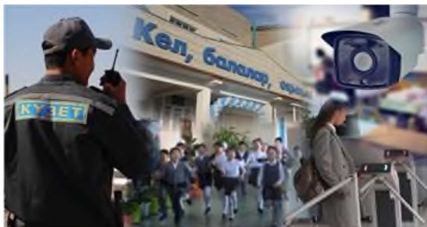
Сурет 1. Қауіпсіздік жүйелері және бақылау құралдары

Бейнебақылау жүйелері (CCTV). Мектеп ғимараттарында және аумағында орнатылған заманауи бейнекамералар оқушылардың қауіпсіздігін қамтамасыз етуге және тәртіп бұзушылықтарды болдырмауға мүмкіндік береді. Мектеп аумағын толық қамтитын бейнекамераларды орнату, қауіпті жағдайларды нақты уақыт режимінде анықтауға және қажет болған жағдайда оқиғаларды қарап шығуға мүмкіндік аламыз.