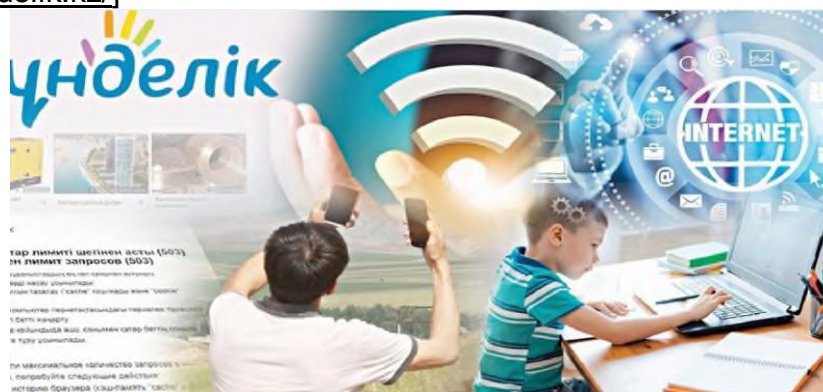
Сурет 6. Цифрлық платформалар

EduPage және Kundelik.kz платформалары. Бұл жүйелер ата-аналарға балаларының үлгерімін, қатысуын және күнделікті жағдайларын бақылауға мүмкіндік береді. [ https://kundelik.kz/ ]