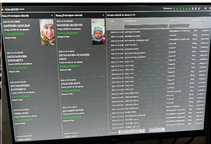
Сурет 3. Биометриялық аутентификация

Сабаққа қатысуды бақылау жүйелері. Оқушылардың сабаққа қатысуын қадағалауға, сабақтан босатылғаны туралы ата-аналарды уақтылы хабардар етуге, сабаққа келмеу мен ерте кетудің алдын алуға мүмкіндік береді. Бұл жүйеде объектілерді тану үшін жасанды интеллект пайдаланылады [4].