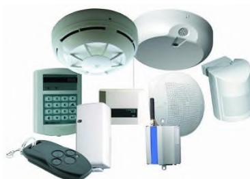
Сурет 5. Дабыл жүйелері

Дабыл жүйелері. Төтенше жағдайларда жылдам әрекет ету үшін орнатылады. Білім беру мекемелерінде төтенше жағдайларда (өрт, эвакуация, шұғыл медициналық көмек) іске қосылатын автоматты сигнал беру тез және тиімді эвакуациялау құрылғыларымен толық қамтамасыз етілген. Сонымен қатар, дабыл жүйелері шұғыл арада оқиға туралы әкімшілік, ата-аналар мен төтенше жағдайлар қызметіне хабарлауға арналған [5].