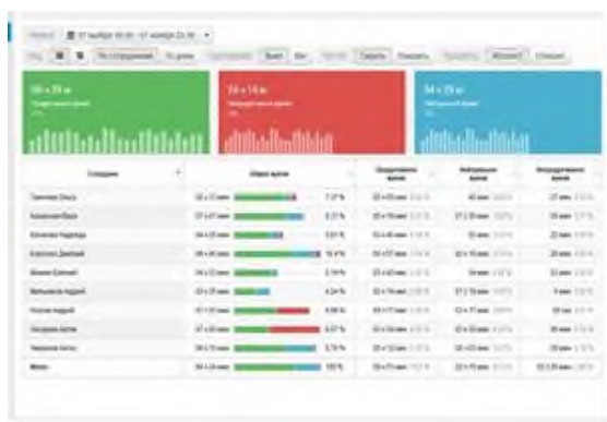
Сурет 4. Сабаққа қатысуды бақылау жүйесі

Сабаққа қатысуды бақылау жүйелері. Оқушылардың сабаққа қатысуын қадағалауға, сабақтан босатылғаны туралы ата-аналарды уақтылы хабардар етуге, сабаққа келмеу мен ерте кетудің алдын алуға мүмкіндік береді. Бұл жүйеде объектілерді тану үшін жасанды интеллект пайдаланылады [4].