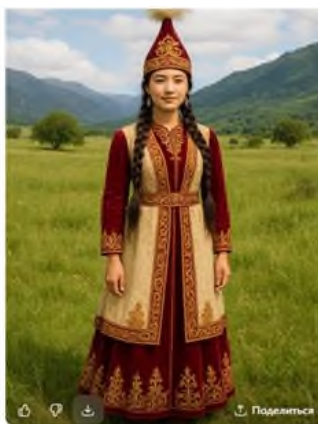
Сурет 1. DALL·E жасанды интеллект бағдарламасы арқылы жасалған сурет

Бейне жасау саласындағы жасанды интеллект