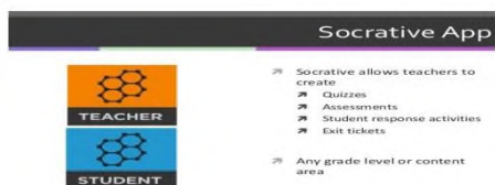
Сурет 5. Socrative

дайын екенін немесе сабақтың соңында (олар жаңа материалды қалай игергенін) білу үшін сабақтың басында жылдам тест өткізуге болады.