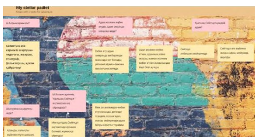
Сурет 4. Padlet

Оқушыларға «Padlet» бағдарламасындағы (Сурет 4) осы сұрақтар жазылған ссылканы жіберіп, оқушылар бүгінгі сабақтан түсінгендерін қорытындылады.