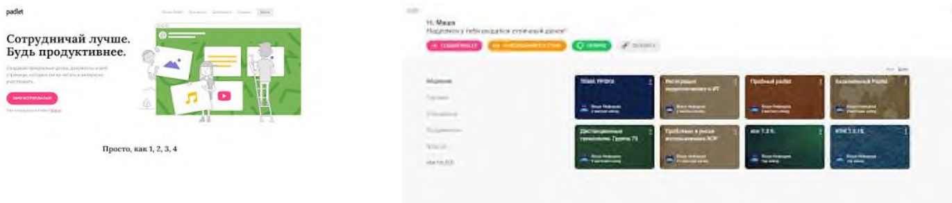
Сурет 1. Жаңа Padlet құрамыз Сурет 2.

Біздің қабырға дайын. Оң жақ жоғарғы бұрышында әр түрлі параметрлер бар: атауы, Фон коллекциясы, қаріптер, қатынау параметрлері, желіде жариялау тәсілдері және т. б.