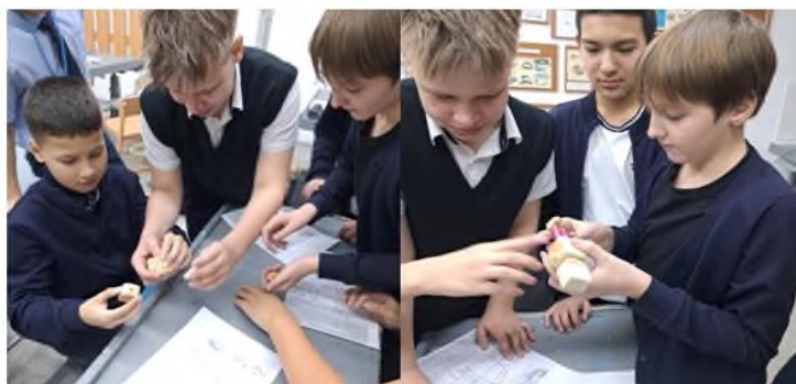
Рисунок 1. Изготовление робота

Так при изучении темы: «Создание робота. Экспериментирование по созданию подвижных частей робота» учащиеся 6–х классов погружаются в мир инженерии и пробуют себя в роли настоящих конструкторов. Хотя на уроках художественного труда нет датчиков и микросхем, как к частности, на робототехнике, но это не мешает овладению навыков ручного труда на примере изготовления простейшего робота.