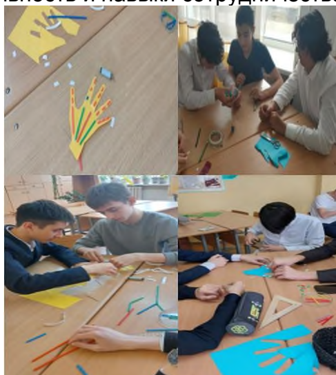
Рисунок 2. Роботизированная рука

Под руководством учителя ребята создают подвижные части для своих роботов. Они учатся конструировать: собирать различные механизмы, экспериментировать: проверять, как работают разные типы передач и рычаги, проектировать: придумывать свои уникальные конструкции, развивать: техническое мышление, креативность и навыки сотрудничества.