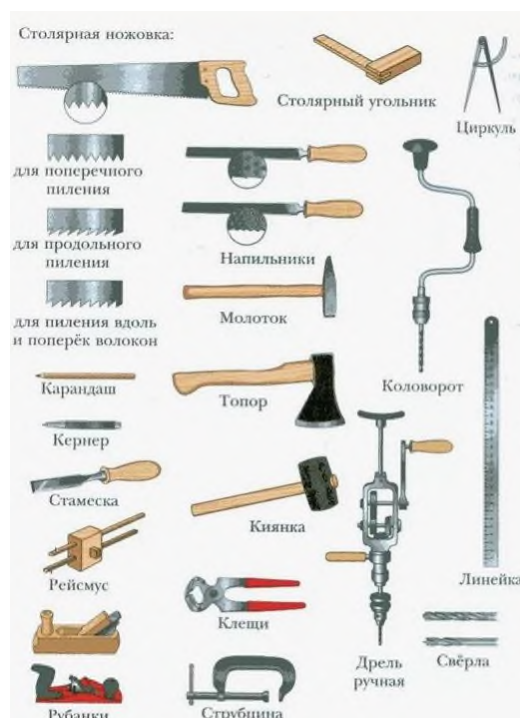
Рисунок 5. Инструменты для обработки древесины