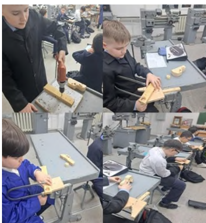
Рисунок 4. Выпиливание изделий

Свойства материалов: Выбор материала зависит от его свойств: твердости, гибкости, плотности. Это знание помогает создавать прочные и долговечные изделия.