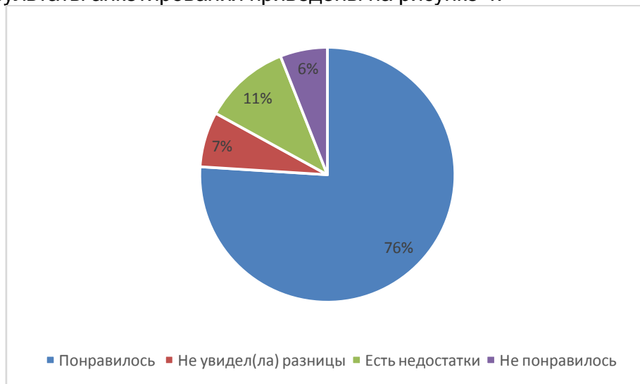
Рисунок 4 – Анкетирование учащихся

Чтобы выявить отношение детей к цифровым технологиям, было проведено анкетирование. Ученикам было предложено оценить такую форму проведения уроков, ответив на вопрос «Является ли данная форма работы более удобной перед традиционным (бумажным) вариантом». Для ответа было предложено 4 варианта ответов. Результаты анкетирования приведены на рисунке 4.