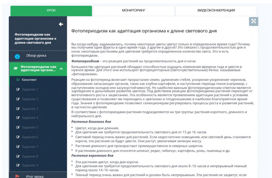
Рисунок 1 – «Урок Фотопериодизм как адаптация организма к длине светового дня»

Созданы и апробированы уроки, видео и для закрепления материала онлайн тесты по темам биологии: Макро– и микроскопическое строение кости. Химический состав костей. Лабораторная работа «Макро– и микроскопическое строение костей». Демонстрация «Химический состав костей» –8 класс. Фотопериодизм как адаптация организма к длине светового дня – 7 класс. По химии: Электрохимический ряд потенциалов –10 класс. Свойства оксидов элементов 14 (IV) группы. –11 класс. В форме урока с закреплением материала. На уроке использовались мультимедийные учебники по биологии и химии для объяснения нового материала и мультимедийный учебник с заданиями для интерактивной доски с помощью, которых проводилось первичное закрепление изученного материала.