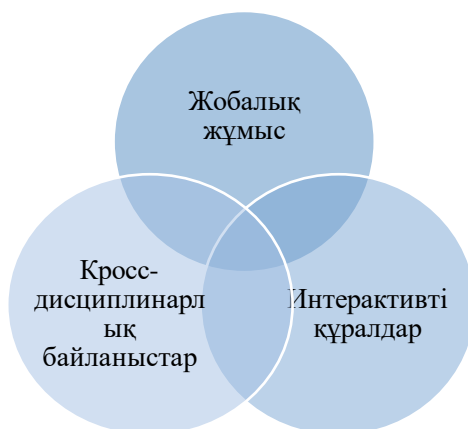
Сызба 1. STEAM технологияларының интеграциясы

Сондықтан да қазақ тілі мен әдебиеті сабақтарында STEAM технологияларын интеграциялау – бұл тек оқу процесінің тиімділігін арттыру ғана емес, сонымен қатар жастарымыздың ұлттық құндылықтарды терең түсініп өсуіне ықпал ететін маңызды бағыт болып табылады [4]. Жаңа әдістерді енгізу арқылы біз болашақ ұрпақтың рухани байлығын арттырып қана қоймаймыз; сонымен бірге оларды заманауи қоғамда белсенді азамат ретінде қалыптастыруға көмектесеміз.