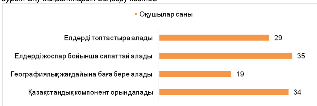
1 - Сурет Оқу мақсаттарын меңгеру кестесі

Жоғарыдағы сандық статистикаға сүйенсек, экспериментке қатысқан оқушылардың басым бөлігі (29 оқушы немесе жалпы экспериментке қатысқан оқушылардың 74,3%) аралда, түбекте, архипилагта, теңіз жағасында, тұтас құрлықта орналасқан елдердің атауларын біледі, бірақ олардың географиялық орнын нақты көрсете алмайды. Бұның басты себебі, оқушылар карталарды кеңістікте елестетуде қиналады. Егер де сипаттап тұрған елді жалпы картадан жеке алып тастасақ, сұрап тұрған елдің көршілерін немесе маңайдағы теңіздерін, бұғаздарын, аралдарын атай алмайды. Картамен жұмыс істеу дағдысы әр оқушыда әркелкі. Кейбіреулері географиялық нысандарды көрсеткенде