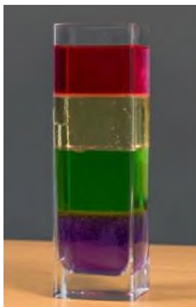
Рисунок 3 «Башня плотности» [7]

Цель: показать различие плотностей разных жидкостей, сравнить плотности жидкостей экспериментальным путем.