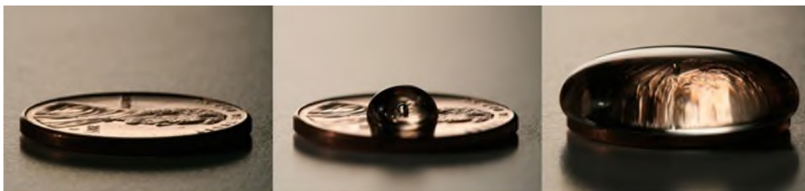
Рисунок 2 Поверхностное натяжение капли воды на поверхности монеты [6]

Предполагаемые результаты: вода на монете будет расположена не ровным тонким слоем. Поверхность воды будет растягиваться и становиться всё более выпуклой с каждой новой каплей до тех пор, пока тонкая плёнка, которую образует поверхность воды, не порвётся. (Рис.2.) Данный эффект объясняется поверхностным натяжением жидкости.