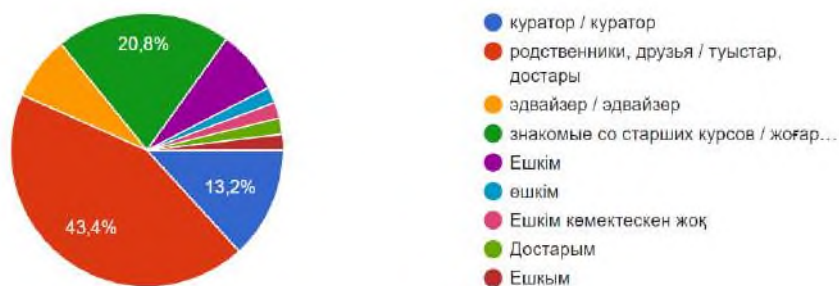
Рисунок 5 – Ответы студентов на вопрос «Кто больше всего помог Вам адаптироваться к местным условиям?»

Администрация ВУЗа, родственники, студенты старших курсов оказывают положительное влияние на адаптацию студентов. 43% респондента отметили, что максимальную помощь и понимание в адаптации оказывают близкие, друзья и родственники, знакомые со старших курсов, земляки – 21% студентов, также помощь и внимание кураторов важны для 20% опрошенных студентов (рисунок 5).