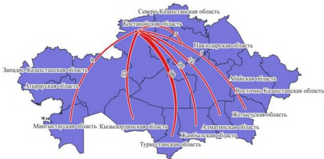
Рисунок 1 – Распределение участников программы «Мәңгілік ел жастары-индустрияға!» – «Серпін-2050» по областям

Для Казахстана важна программа «Серпін-2050» и КРУ имени Ахмет Байтұрсынұлы является одним из ведущих вузов, который предоставляет возможность обучения по данной программе. Результаты первого блока опроса представлены на рисунке 1. Лидером по количеству прибывших стала Туркестанская область – 56,6% ответов. На втором месте Кызылординская и Жамбылская области – 13,2%, из Алматинской области прибыло 7,5% студентов.