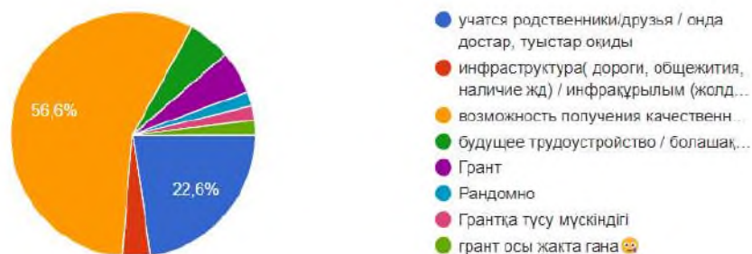
Рисунок 3 – Ответы студентов на вопрос «Какие факторы повлияли на выбор КРУ им. Ахмет Байтұрсынұлы как место Вашего обучения?»

Результаты следующего вопроса представлены на рисунке 3. Более 50% респондентов считают, что возможность получения качественного образования является приоритетом. Для 22,6% студентов важным фактором при выборе университета является мнение родителей. Также значимыми аспектами для абитуриентов являются получение гранта и перспективы трудоустройства. При выборе специальности 30% респондентов указали, что всегда «мечтали быть учителями». Профессия учителя традиционно пользуется уважением в обществе. Для студентов, обучающихся на педагогических программах в республике Казахстан, предусмотрены ряд программ: государственные образовательные гранты (высокий проходной балл 75 и выше), стипендии (с 1 сентября 2025 год от 84000 тенге), стабильный спрос на рынке труда.