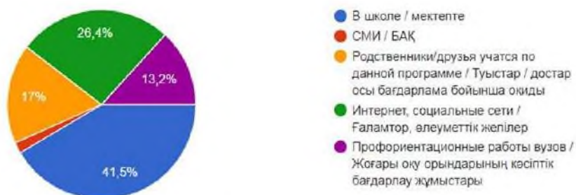
Рисунок 2 – Ответы студентов на вопрос «Из каких источников информации Вы узнали о программе «Мәңгілік ел жастары-индустрияға!» – «Серпін-2050?»

Следующие вопросы характеризуют основную содержательную часть профориентационной деятельности. На рисунке 2 представлен ответ на вопрос «Из каких источников информации Вы узнали о программе «Серпін-2050?», было выяснено, что 41,5% респондентов узнали в школе, что говорит о большой вовлеченности школьников в свое образование и о высоком качестве проведения профориентационных работ среди учащихся. Данному факту способствует профориентационные кампании, которые проводят университеты. В 2024 учебном году университетом имени Ахмет Байтұрсынұлы было охвачено 2061 выпускников школ и 357 студентов колледжей. Вторую группу ответов в данном опросе занимают социальные сети (26,4%) и сайты такие как: instagram, tiktok. В каждом университете имеется свой сайт, где подробно написано о программе и выделены пункты для поступления в вуз. Третью группу источников составляют родственники, потому что 17% опрошенных студентов узнали о данной программе благодаря близким и друзьям, которые уже обучаются по программе «Серпін». И только 1,9% из числа опрошенных студентов, узнали о программе через средства массовой информации (СМИ).