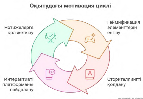
Сурет 1. Оқытудағы мотивация циклі

Кестеде көрсетілгендей, интерактивті новелла құрылымында ойындық элементтер мен визуалды белгілер тек көңіл көтеру құралы емес, сонымен қатар білім берудің маңызды тетігі ретінде қолданылады. Мысалы, «ақаулар» арқылы қате код жазу жағдайы көрініс табады, бұл өз кезегінде оқушыны өз әрекетін сараптауға үйретеді. Бағдарламаны оқытудың логикасын толық сипаттау және оның әсерін айқын көрсету үшін төменде инфографика үлгісі берілген. Инфографика оқу моделінің кезеңдерін жүйелеп, интерактивті новелладағы оқу механикасының өзара байланысын көрсетеді.