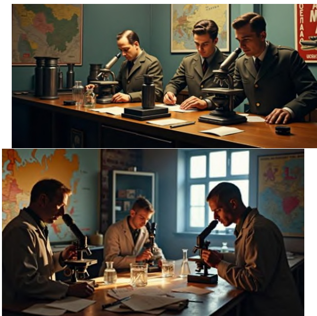
Рисунок 3 – Иллюстрированный материал к СЗ «Формула для фронта»

Представьте, что вы – химик-аналитик в военной лаборатории в 1942 году. Вам достался образец неизвестного углеводорода, который, как предполагается, может быть перспективным компонентом нового, высокооктанового бензина для авиации. Ваша задача – определить эмпирическую и молекулярную формулы этого углеводорода по результатам его полного сгорания, чтобы оценить его энергетический потенциал.