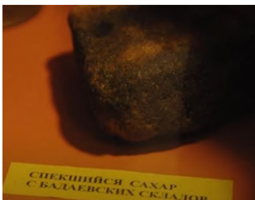
Рисунок 2 – Иллюстрированный материал к СЗ «Бадаевская земля»

СЗ «Бадаевская земля»: 8 сентября 1941 года фашистская авиация разбомбила Бадаевские склады в Ленинграде, где хранились основные запасы продовольствия, включая сахар. Пожар на складах привел к тому, что расплавленный сахар смешался с землей (рис. 2). Голодным жителям блокадного Ленинграда ничего не оставалось, как использовать данную землю, чтобы добыть хоть небольшое количество сахара [6, с. 26].