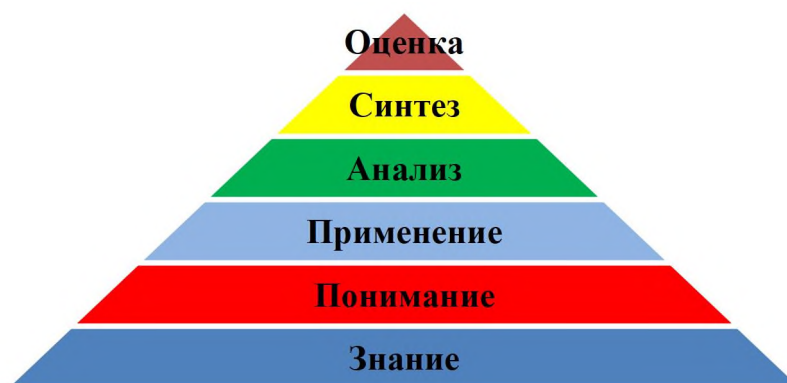
Рисунок 1 – Виды мыслительных навыков по таксономии Блума, востребованные при конструировании и выполнении СЗ.

Практическая апробация методики проводилась в КГУ «Средняя школа № 17 акимата г. Рудного» среди учащихся 8–11 классов. Эксперимент подтвердил, что включение исторического контекста в уроки химии повышает мотивацию и усиливает воспитательное воздействие учебного материала.