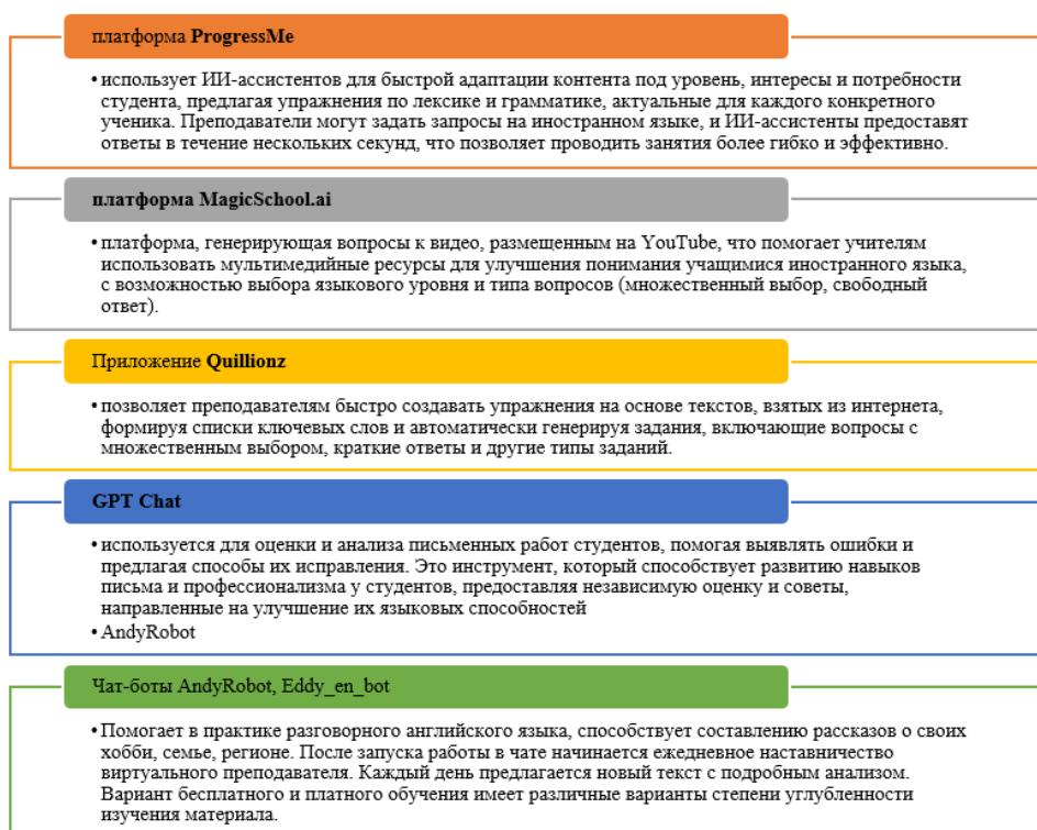
Рисунок 2. Инструменты на базе искусственного интеллекта, применяемые на уроках английского языка [7]

На рисунке 2 представлены самые популярные инструменты, созданные на основе нейросетей и активно применяемые сегодня в образовательной практике – это платформы ProgressMe, MagicSchool.ai, приложение Quillionz, чат-боты AndyRobot, Eddy_en_bot, GPT Chat.